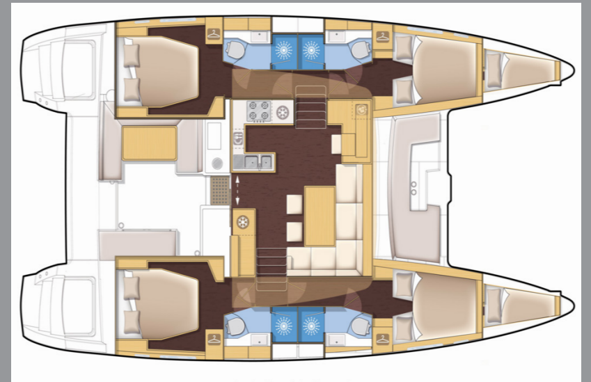
L a g o o n 4 5 0