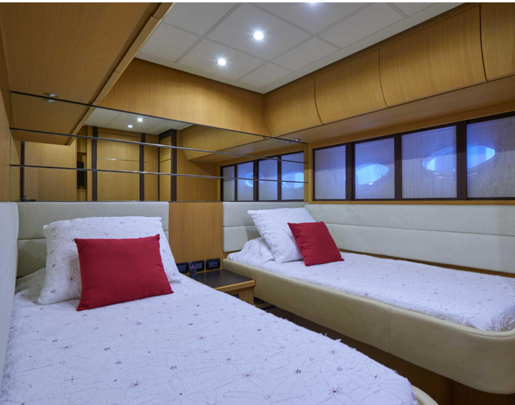
Camarote Twin babor