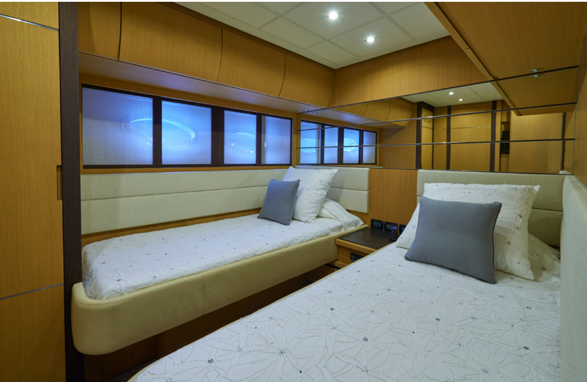
Camarote Twin estribor