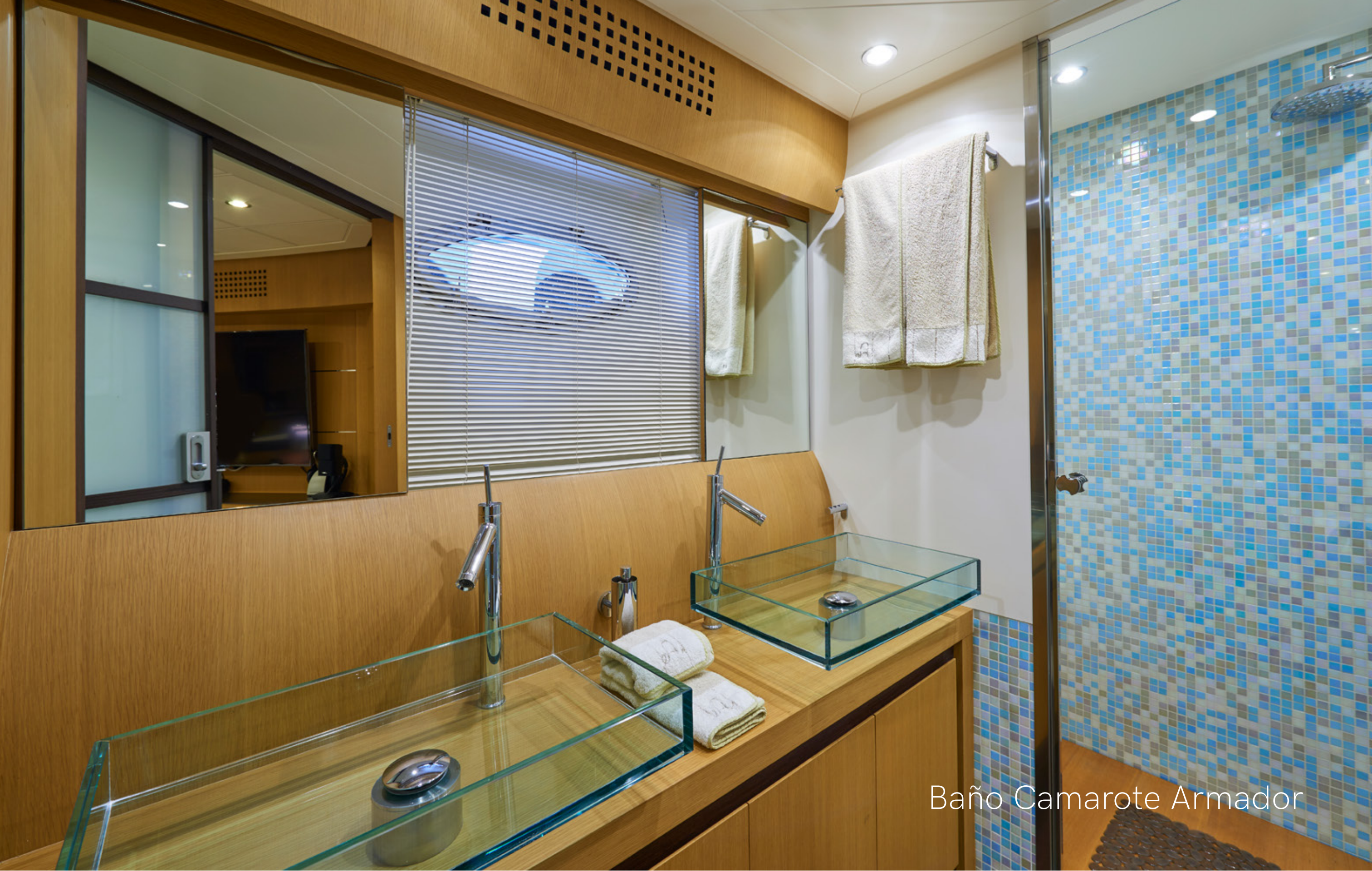
Baño Camarote Armador